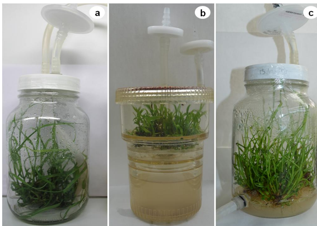
Figura 1. Sistemas de Inmersión Temporal. a) Biorreactor de Inmersión Temporal (BIT), b) Recipiente de Inmersión Temporal Automatizado (RITA) y c) Biorreactor de inmersión por gravedad (BIG).

La micropropagación a escala comercial de la mayoría de los cultivos de importancia económica como la caña de azúcar está casi siempre limitada por los altos costos de producción que la tecnología requiere. La semi-automatización de la micropropagación por lo tanto, juega un papel fundamental y la integración de los SIT ofrece una alternativa práctica para reducirlos (Mordocco y otros, 2009). Los SIT evaluados en este trabajo mostraron un buen desempeño en la formación de nuevos brotes si se comparan con la micropropagación convencional de caña de azúcar en medio semisólido obtenidos en otros estudios (Lee, 1987; Lakshmanan y otros, 2001; Cheema y Hussain, 2004; Mamun. y otros, 2004; Ramanand y Lal, 2004; Ming y otros, 2006; Ali y otros, 2008; Sengar, 2011).